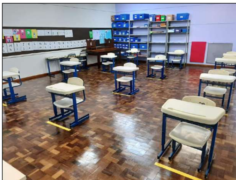
Figura 3. Imagem da sala de aula identificada com a sua capacidade máxima, respeitando o distanciamento de 1,5m entre cada aluno.

Cada espaço escolar está identificado com o número de pessoas que comporta. Respeitando o distanciamento físico previsto na Resolução 1.231/2020, emitida pela Secretaria da Saúde do estado do Paraná, a instituição promoverá o distanciamento de no mínimo 1,5m (um metro e 50 centímetros) entre os alunos. Para isso, todas as salas foram marcadas, respeitando esse distanciamento, conforme Figura 3. Não será permitida aos alunos a movimentação das carteiras durante as aulas, impedindo a violação do distanciamento.