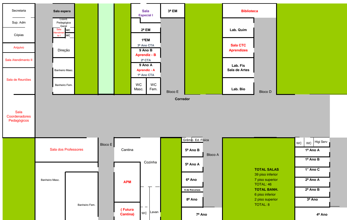
Figura 1. Planta baixa do 1º piso do Colégio Imperatriz Dona Leopoldina. A marcação em verde refere-se às áreas externas existentes entre cada pavimento.

Nas figuras 1 e 2 tem-se a planta baixa do pavimento da educação básica e do ensino profissionalizante. Pode-se evidenciar através da cor verde que os espaços externos entre os blocos de salas de aulas são generosos, assim como os ambientes escolares, uma vez que as turmas possuem números médios de estudantes, sendo entre 10 e 20 alunos por turma, o que facilita a organização do ambiente para o distanciamento.